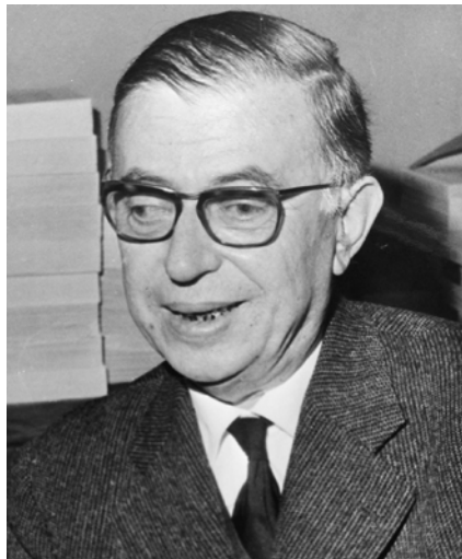
Dans sa pièce de théâtre Huis clos, Jean-Paul Sartre fait dire à un de ses personnages : « L'enfer c'est les autres ».

La gestion des émotions pourrait tenir à très peu de choses et nous ne pourrions pas tout maîtriser. Le développement émotionnel est fait à la fois du biologique et de l'environnemental et il y a également l'effet miroir que l'on a compris grâce à la découverte par Giacomo Rizzolatti des neurones miroirs dans les années 1990.