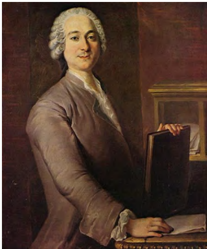
Selon le marquis de Vauvenargues : « Nous sommes trop inattentifs, ou trop occupés de nous-mêmes, pour nous approfondir les uns les autres. »

catastrophe nucléaire, réchauffement climatique...), social et/ou politique (guerre, terrorisme, surpopulation, famine...).